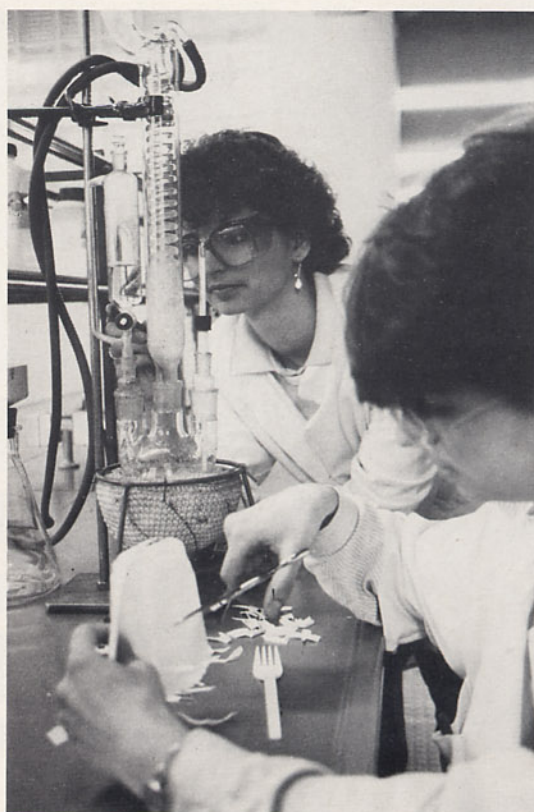
Kunststoff-Recycling im Organisch-Präparativen Praktikum: Durch die alkalische Hydrolyse eines Polycarbonats wird Bisphenol A isoliert.

Den Schülern macht es großen Spaß, selbstgesammelte Kunststoffabfälle zu wertvollen Rohstoffen aufzuarbeiten. Daß das geht und wünschenswert ist, prägt sich so auch besser ein.